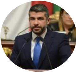
Mauricio Tabe Alcalde de Miguel Hidalgo