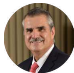
Enrique Yamuni Presidente de CANIETI

CANIETI, junto con diversas alcaldías de la Ciudad de México y algunos operadores de servicios de telecomunicaciones, continúan con la estrategia que impulsa el retiro de los cables aéreos obsoletos y reestructurar la infraestructura de telecomunicaciones. En esta ocasión, se firmaron convenios con las demarcaciones de Miguel Hidalgo y Azcapotzalco.