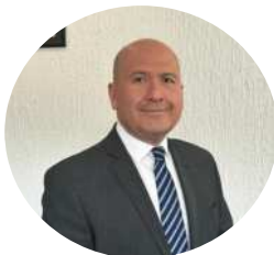
Alfredo Pacheco Director General de CANIETI