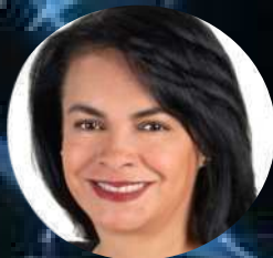
Margarita Saldaña Alcaldesa de Azcapotzalco