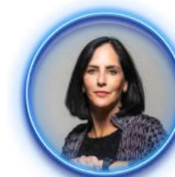
Lía Limón García Alcaldesa de Álvaro Obregón